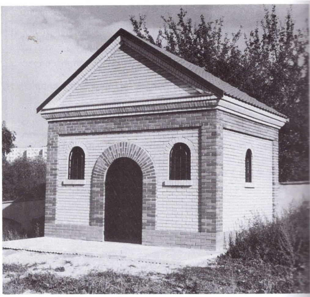
למעלה: "האוהל" שעל קברי האדמו"רים מלובלין (תורת אמת, רבי צדוק הכהן, שבט מיהודה) – כיום. למטה: "האוהל" הישן על הקברים, שנחרב בשואה