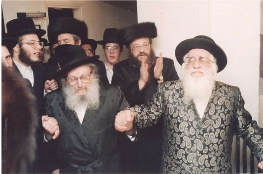
כ"ק מרן אדמו"ר זצ"ל בריקוד של שמחה עם כ"ק מרן האדמו"ר מויז'ניץ זצ"ל בעל "ישועת משה"