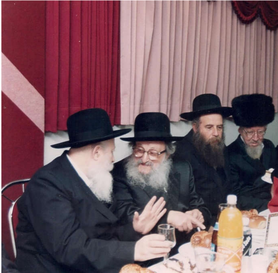
כ"ק מרן אדמו"ר זצ"ל, בשיחה עם יבלחט"א כ"ק מרן אדמו"ר מגור שליט"א. למטה: כ"ק מרן אדמו"ר זצ"ל במעמד סיום הש"ס דף היומי בבני ברק, לצדו כ"ק אדמו"ר מנאראל זצ"ל