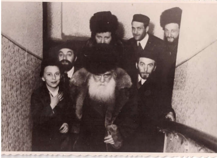
במרכז התמונה: כ"ק הרה"צ אדמו"ר מקרימילוב זצלה"ה הי"ד זקנו של כ"ק מרן אדמו"ר זצוק"ל (צולם בשמחה משפחתית) בפינה למעלה מצד ימין: כ"ק מרן זצ"ל