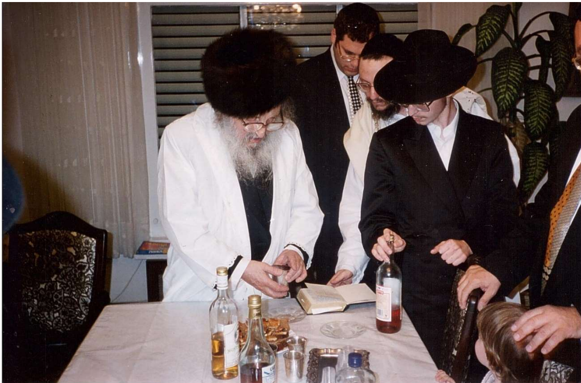
כ"ק מרן אדמו"ר זצוק"ל עורך "הבדלה" במוצאי יום כיפור בביתו נאווה קודש

"לאשר הנני יודע כי הנכם צמאים לשמוע איזה דבר מפה, אוכל להודיעכם כי ההנהגה היא כעת גבוה מאד בל"א "זייער שאַרף". ביום כיפור העבר, הופיע מרן שליט"א לבית המדרש לתפילת המוספין בערך רבע שעה קודם שקיעת החמה, ואף התפילה בלחש של מוסף כבר התפללנו לאור העלעקטריע" [=חשמל]. (ע"כ)