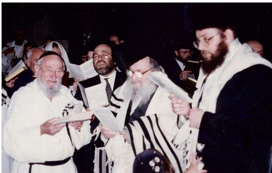
כ"ק הרבי זצוק"ל במוצאי יום הכפורים ב"קידוש לבנה"

זכותו הגדולה של הרבי זצ"ל תגן עלינו ועל כל ישראל להתברך בשנה טובה ומתוקה!