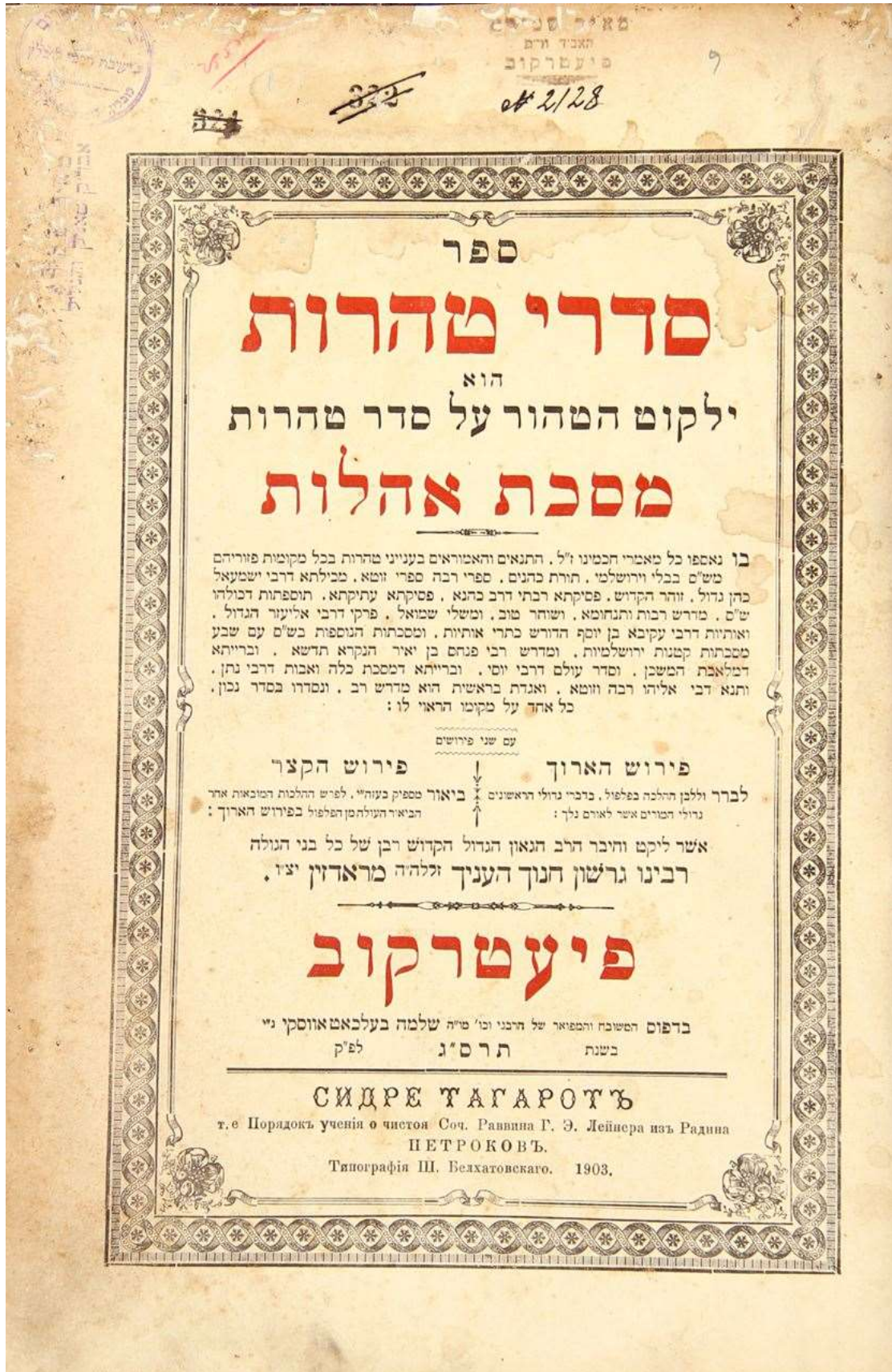
שער הספר "סדרי מהרות" על מסכת אהלות (פיעטרקוב תרס"ג) שהיה שייך להגאון רבי מאיר שפירא זצ"ל רבה של לובלין (עם חותמת רבנות סאניק ופיעטרקוב, וחותמת הישיבה)