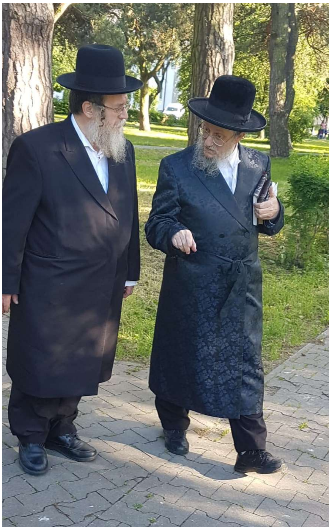
כ"ק אדמו"ר שליט"א במשעלי שטח בית הקברות היהודי בוולודאבה (כיום 'פארק') בדרך לציון מרן