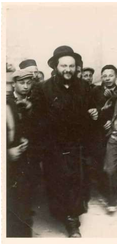
תמונת כ"ק מרן אדמו"ר רבנו שמואל שלמה זצוקללה"ה