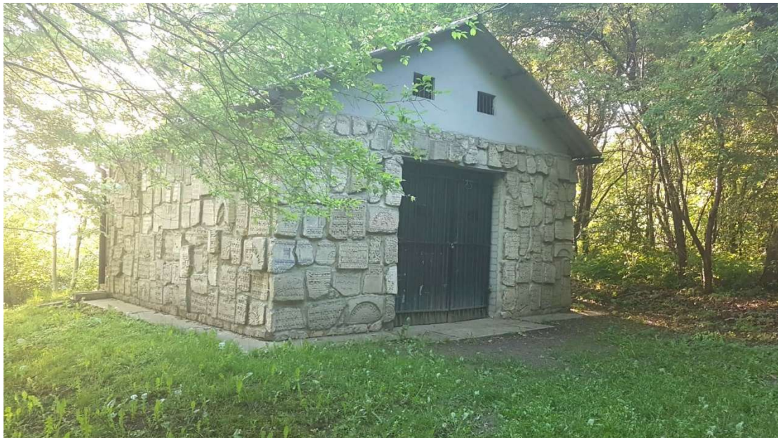
אהל מרן בעל "מי השלוח" זי"ע כיום בעיירה איזביצא