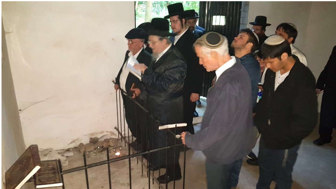
חבורת אנ"ש שיחי' מעתירים בתפילה באהל מרן הקדוש "מי השלוח" זי"ע; (למטה) קבוצת אנ"ש שי' בראשות כ"ק אדמו"ר שליט"א ביציאה מן האהל