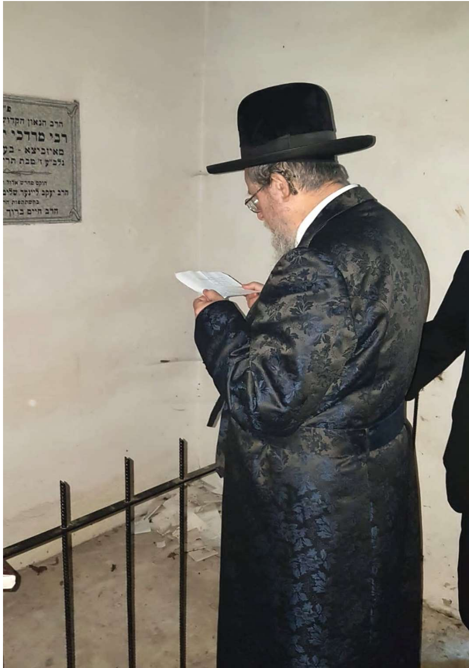
כ"ק מרן אדמו"ר שליט"א מעתיר בתפילה באהל מרן בעל "מי השלוח" זי"ע באיזביצא

מכאן נסעה הקבוצה באוטובוס לכיוון העיר 'לובלין', שם עמד להיחתם יום המסע רב הרושם בין כותלי הבניין הגדול והמפואר של 'ישיבת חכמי לובלין' שנודעה בשמה לתפארה, אשר כוננו ידי הגאון הגדול תפארת ישראל מרן רבי יהודה מאיר שפירא זצ"ל, רבה של לובלין לפני השואה ומייסד לימוד 'דף היומי' העולמי, שלאורו מתחממים רבבות אלפי ישראל בעולם היהודי כולו די בכל אתר ואתר, עד שאין לך קיבוץ יהודי בכל מקום בעולם, שאין שם קביעות לימוד במסגרת שיעור 'דף היומי'. רבי מאיר זכה וזיכה הרבים לדורו ולדורות, עד ביאת משיחנו וגואלנו במהרה בימינו.