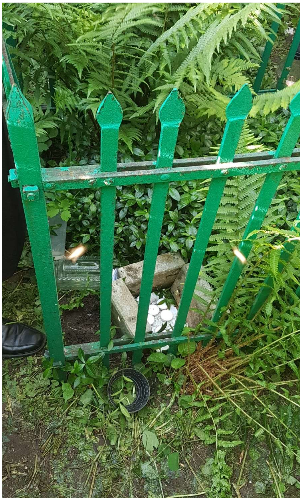
מקום הציון כפי שנגלה לעיני חברי הקבוצה לאחר מערך החיפוש