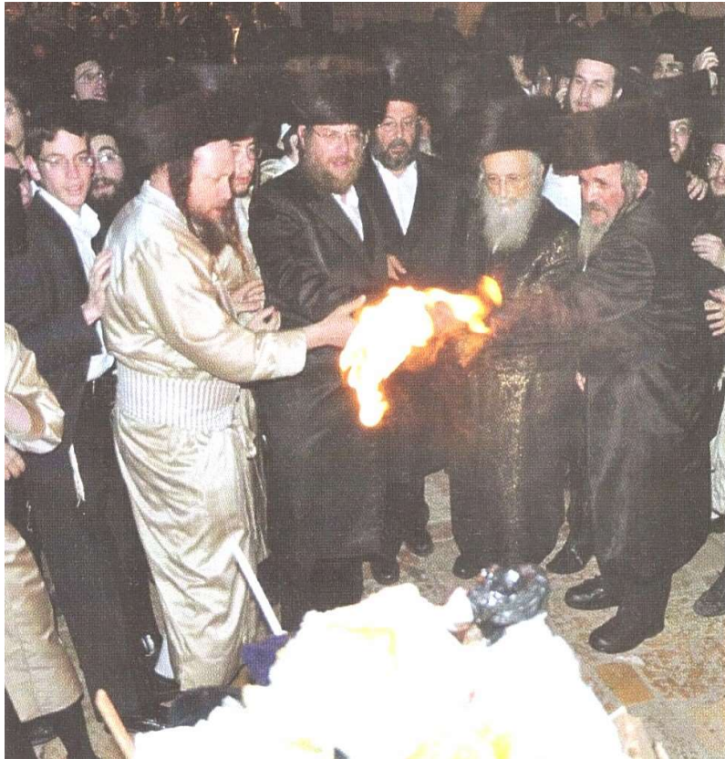
למעלה: הדלקה בל"ג בעומר בידי כ"ק גאב"ד ירושלים שליט"א.