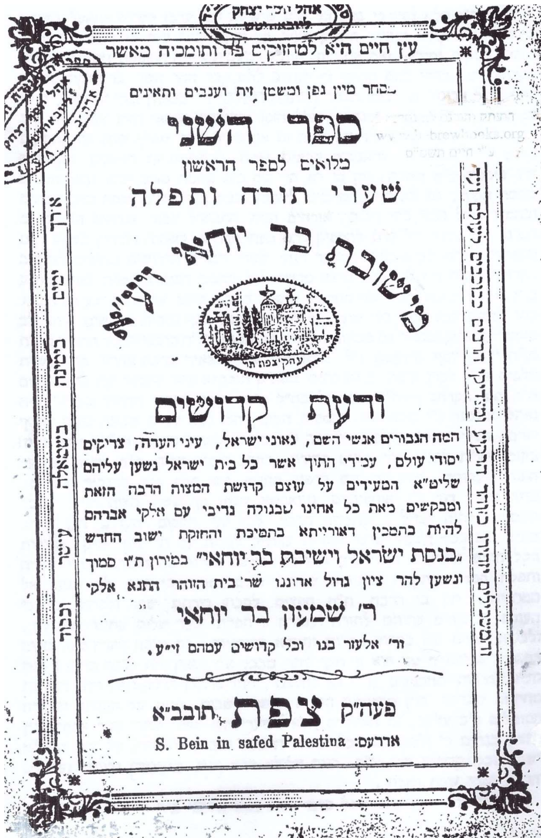
קונטרס הנדיר 'שערי תורה ותפלה' (צפת - תרס"ה?)