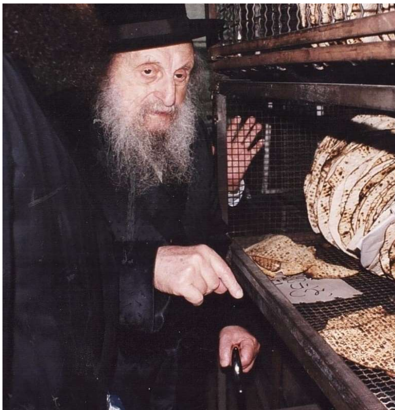
כ"ק מרן אדמו"ר זצ"ל בעת הפרשת חלה מן המצות