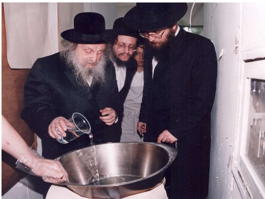
כ"ק מרן זצ"ל בעירו המים שלנו אל הקמח

ד. כל משך זמן אפיית המצות היה כ"ק מרן זצ"ל אפוף בשלהבת קודש של מצווה, כשהוא מסובב בלוויית מקורביו בין העושים במלאכת הקודש ומשגיח בעין פקוחה על הכול שיהיה נעשה בזריזות כדת וכדין 6 . לעיתים אף לא מנע הערותיו, במקום שסבור היה כפי דעת קדשו שיש לעשות הדברים באופן מסוים או אחר דווקא.