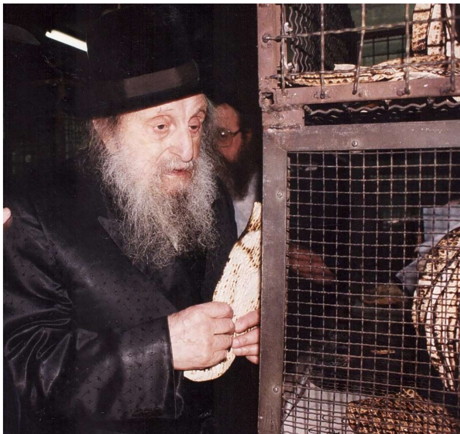
כ"ק מרן זצ"ל בעת הפרשת חלה מן המצות

לצד רבנו לגמרי בהלכה זו ["דער רבי איז גירעכט געוועזען הינדערט פראצענט"!!]