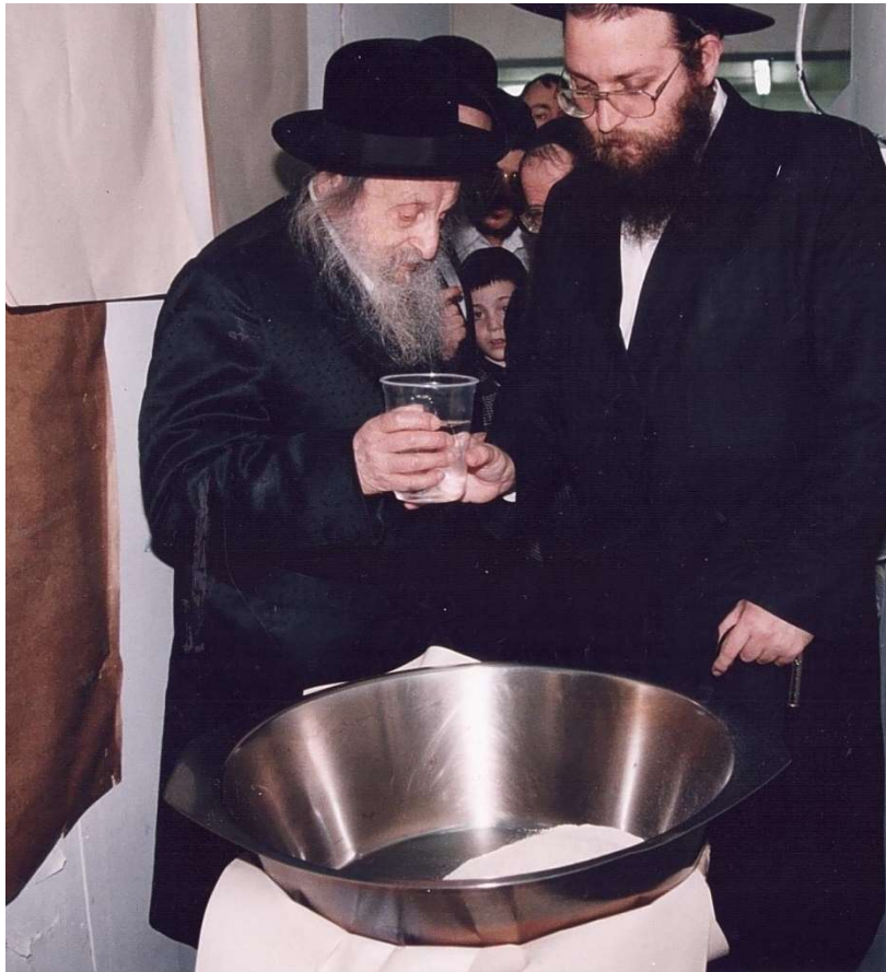
כ"ק מרן זצוק"ל בעת נתינת המים לתוך הקמח

במקומו), אולם כל זאת ללא הצלחה. מרן זצ"ל כדרכו בקודש התעקש להשתתף בעצמו במצווה חביבה זו.