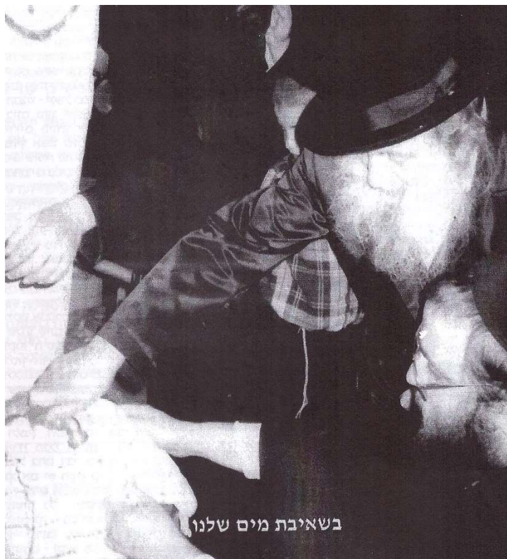
שאיבת מים שלנו ע"י כ"ק אדמו"ר זצ"ל

יא. כל שעת השאיבה, ניכרת הייתה על פניו של כ"ק מרן זצ"ל התרגשות של מצווה ונהרה הייתה שפוכה על זיו איקונין שלו. עם סיום עבודת הקודש של שאיבת "מים שלנו", היה כ"ק מרן שש ושמח, ומאחל בפי קדשו לקראת הבאים בברכת "חג פסח כשר ושמח" ("א כשרע און א פרייליכע יום טוב"), ושנזכה אי"ה בקיום המצווה גם לשנה הבאה ("אי"ה איבער אַ יאָר!") מתוך בריאות טובה עם כולנו יחד ("מיט אללע צוזאמען"), בביאת גואל צדק במהרה!